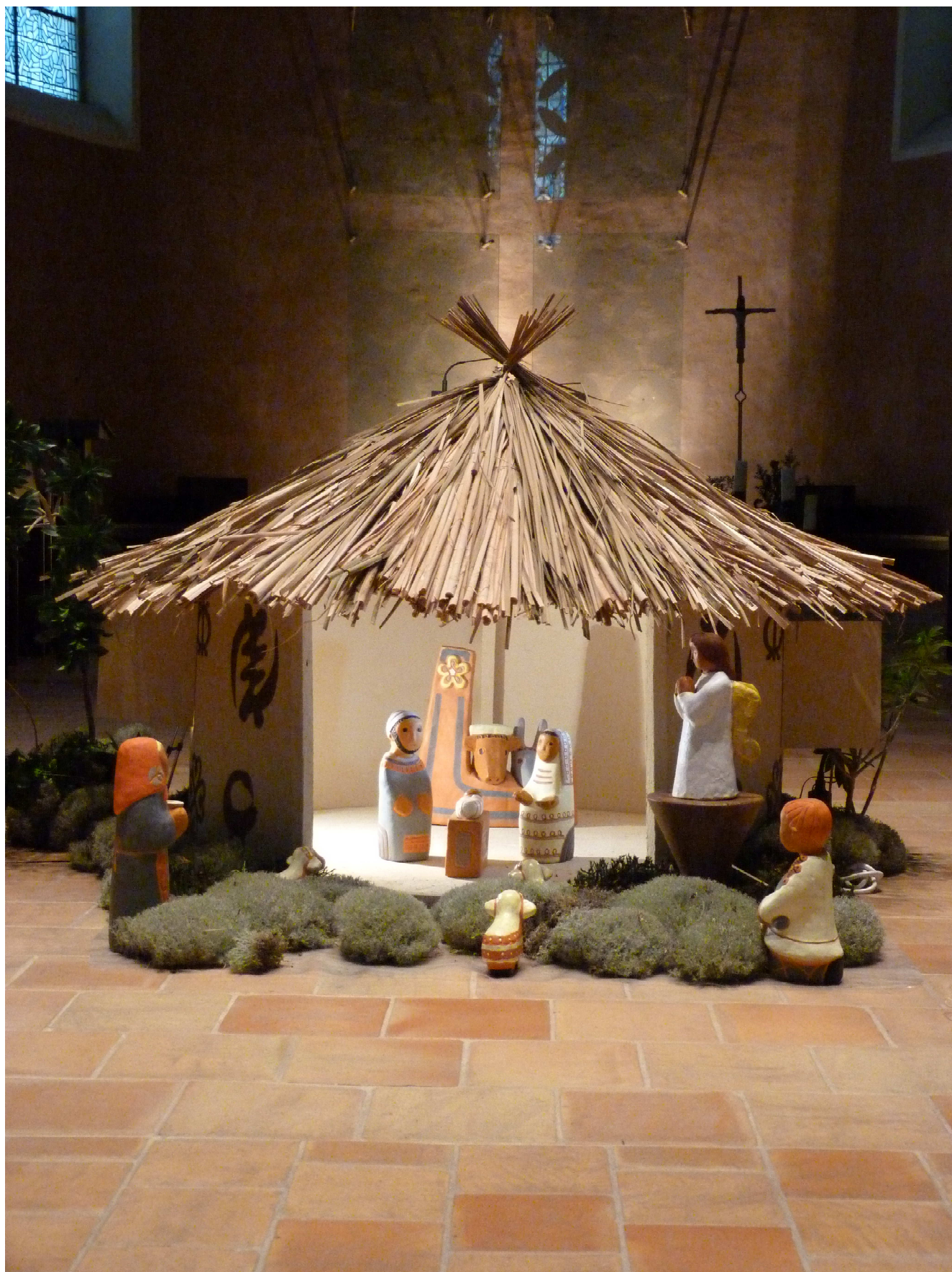
Abbaye Notre Dame de Jouarre