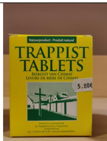
Levure de bière 5,80€