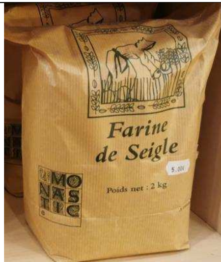
Farine de seigle – 5€