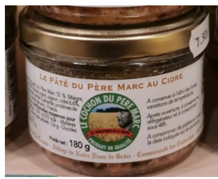
Pâté du P. Marc au cidre – 7,90€