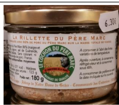
Rillettes P. Marc – 6,30€