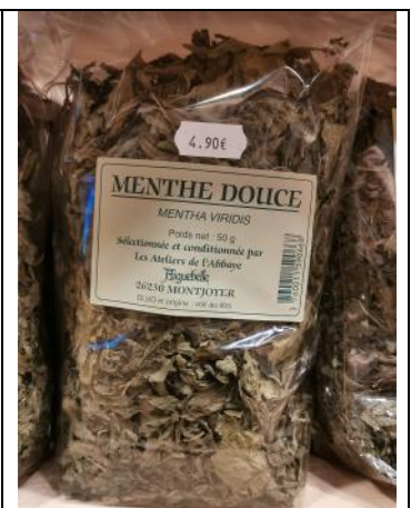
Menthe douce 4,90€