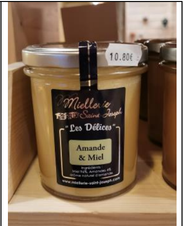
Amande et miel – 10,80€