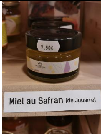
Miel au Safran (de Jouarre)