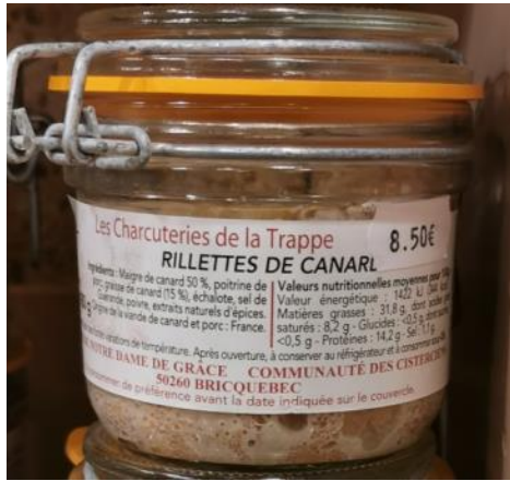
Rillettes de canard – 8,50€