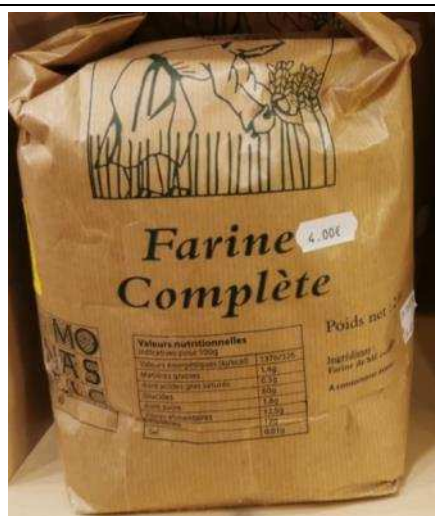
Farine complète – 4€