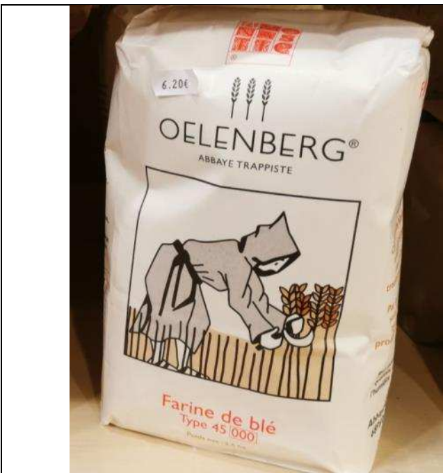
Farine T45 – 6,20€