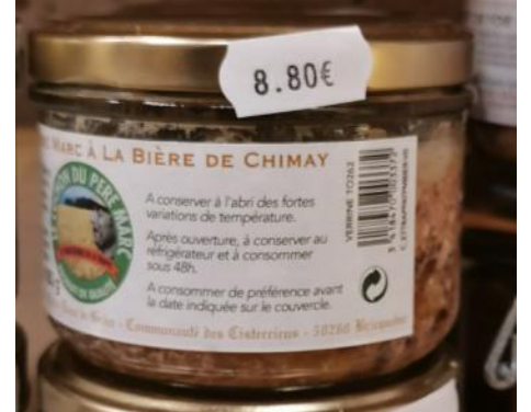
Pâté du P. Marc à la bière – 8,80€