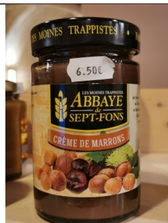
Crème de marrons – 6,50€