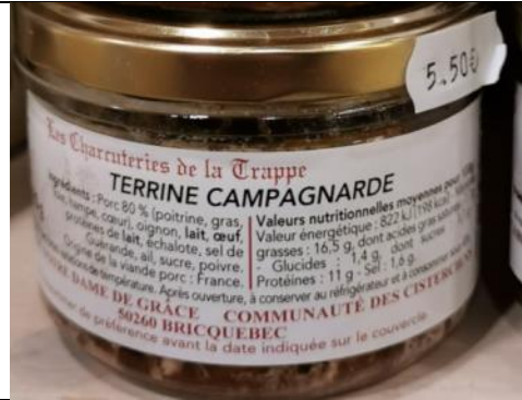
Terrine campagnarde – 5,50€