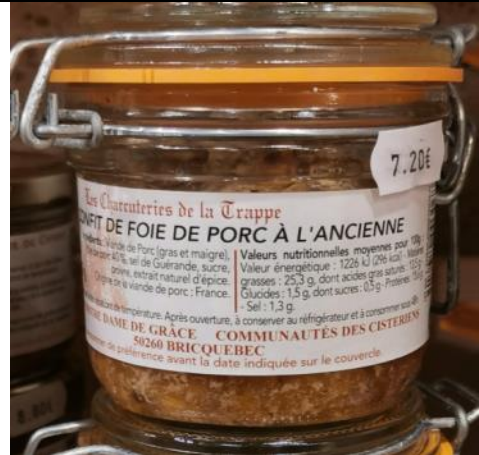
Confit de foie de porc – 7,20€