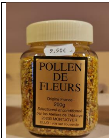
Pollen de fleurs – 9,50€