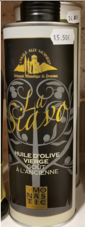
Huile d'olive du Barroux – 15,30€