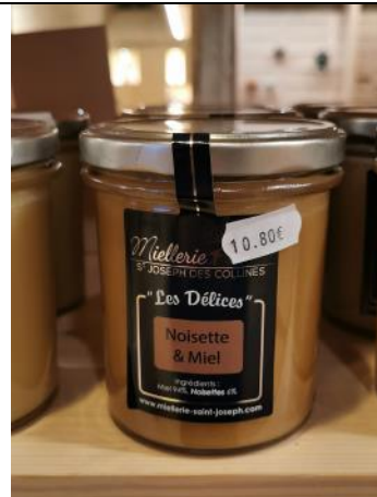
Noisette et miel – 10,80€