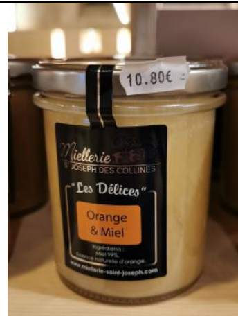
Orange et miel – 10,80€