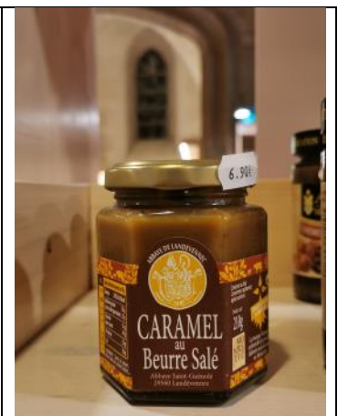
Caramel au beurre salé – 6,50€