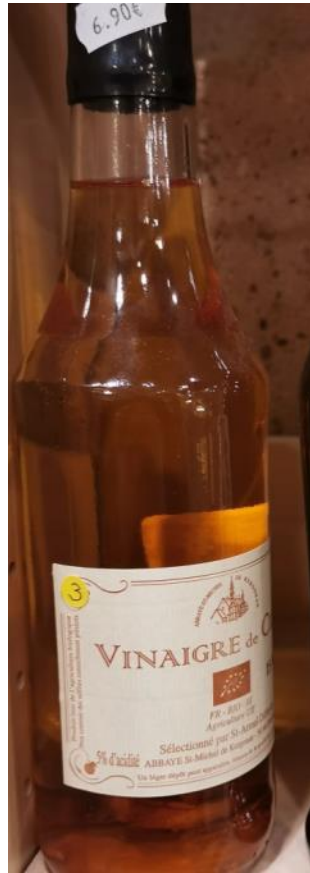
Vinaigre de cidre – 6,90€