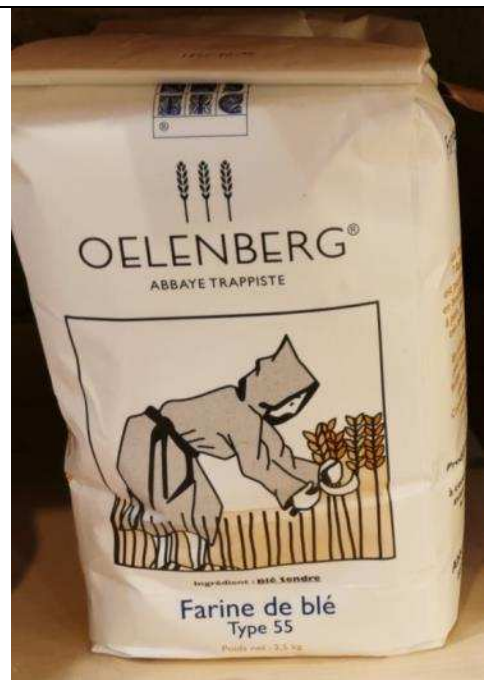
Farine T55 –