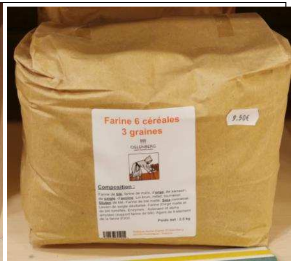
Farine 6 céréales 3 graines – 9,50€