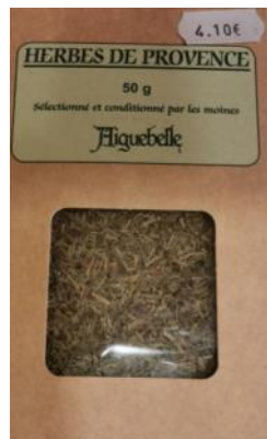
Herbes de Provence