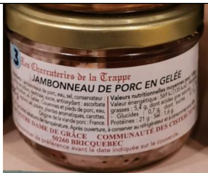
Jambonneau de porc