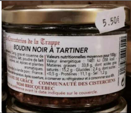
Boudin noir à tartiner – 5,50€