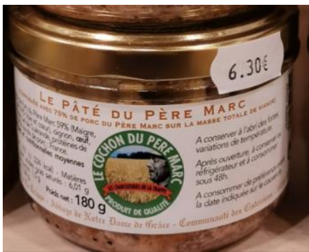
Pâté du P. Marc – 6,30€