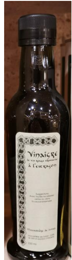
Vinaigre à l'estragon –