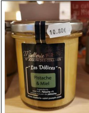
Pistache et miel – 10,80€